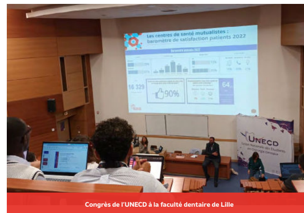
Congrès de l'UNECD à la faculté dentaire de Lille

L'Union régionale a la volonté de renforcer les liens entre les gestionnaires de livre 3 et ses différents services.