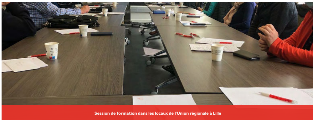
Session de formation dans les locaux de l'Union régionale à Lille

L'Union Régionale a organisé en 2023, 8 sessions de formation en collaboration avec le service formation de la FNMF. Au total, 49 élus , émanant des mutuelles adhérentes à la Mutualité Française Hauts-de-France ont suivi une session de formation en 2023, soit une baisse de 40% par rapport à 2022.