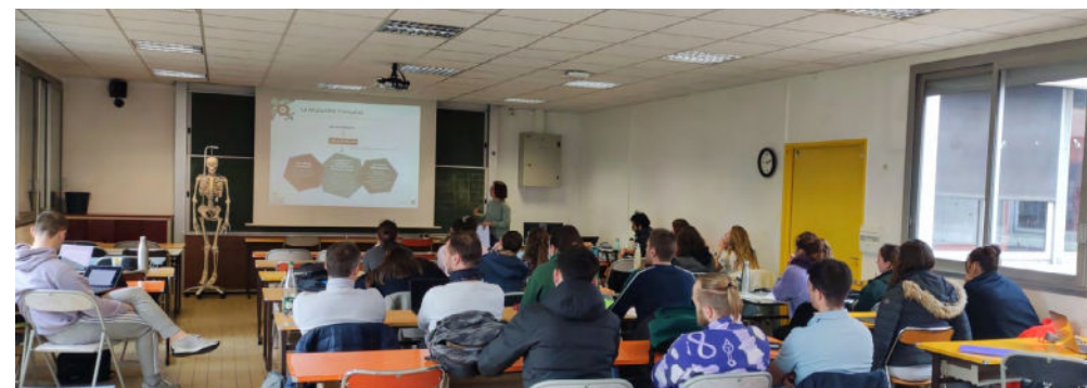
Sensibilisation des étudiants de dernière année à l'IFMK d'Amiens (06/04)

La Mutualité Française a dénoncé l'accord cadre national relatif au Recours Contre Tiers, signé en mai 2018, et a décidé de manière unilatérale de mettre fin à l'expérimentation avec effet en mars 2023.